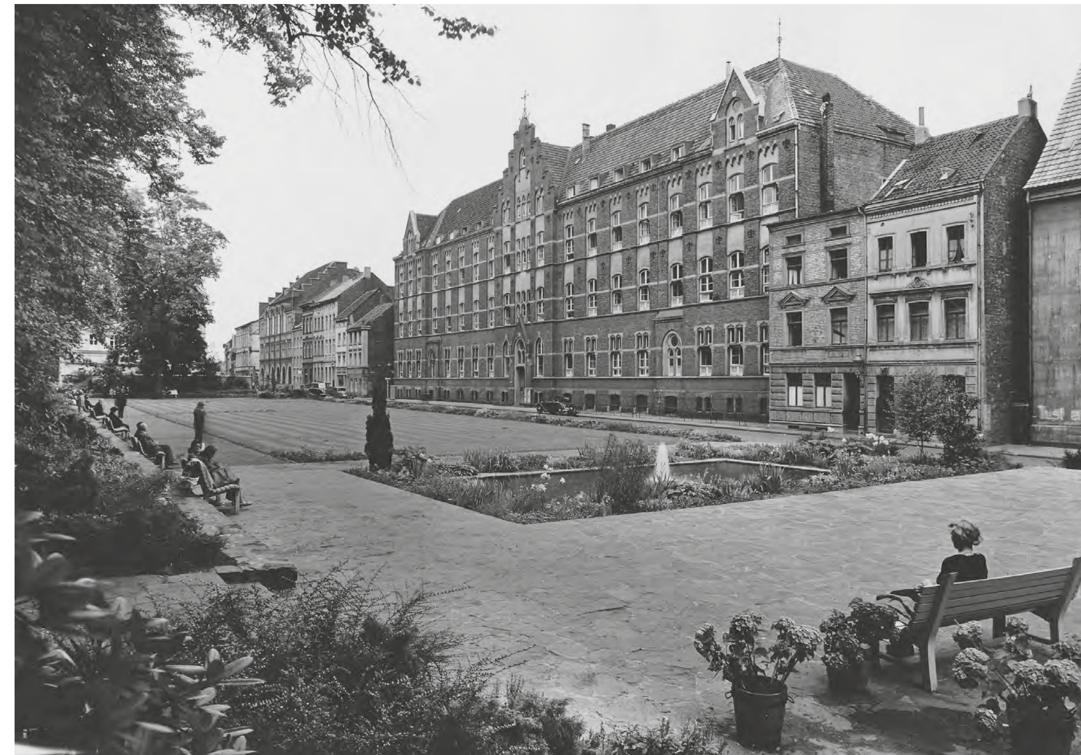
Ansicht des Hauptgebäudes von der Promenade aus, 1950er Jahre

1844 hatten diese unter Leitung von Johanna Etienne aus Grimlinghausen bereits die Krankenpflege im städtischen Hospital an der Brückstraße übernommen. Im Zuge der Erweiterung ihres Tätigkeitsbereichs bezogen sie 1874 ein Gebäude mit kleiner Kapelle („Zum heiligsten Herzen“) an der Michaelstraße. Dieses sogenannte Herz-Jesu-Kloster diente den in der ambulanten Krankenpflege tätigen Schwestern als Wohnort und bildete mit 30 Betten zur privaten Krankenpflege den Ausgangspunkt des späteren Krankenhauses, das ab 1901 das Hospital an der Brückstraße ersetzte. Zum neuen Klosterkomplex gehörte auch das sogenannte „ Weißes Haus “ – ein um 1909 im Klostergarten erbautes klassizistisches Nebengebäude.