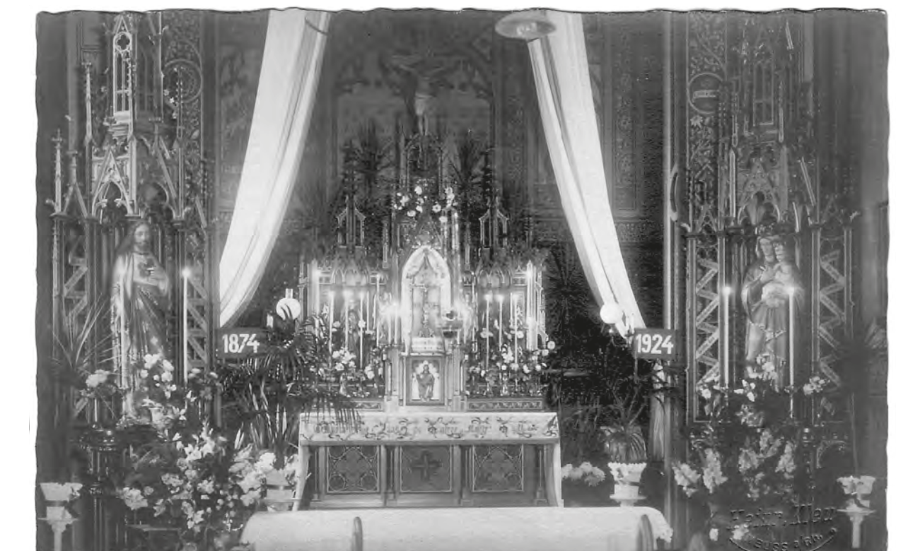
Die Klosterkapelle geschmückt anlässlich der Feierlichkeiten zum 50-jährigen Jubiläum der Übernahme der Kapelle und des Klosters, 1924