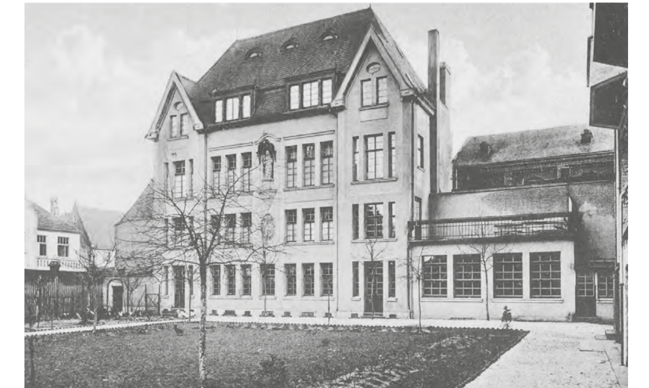
Das sogenannte „Weißes Haus“ im Garten des Klosters, um 1910