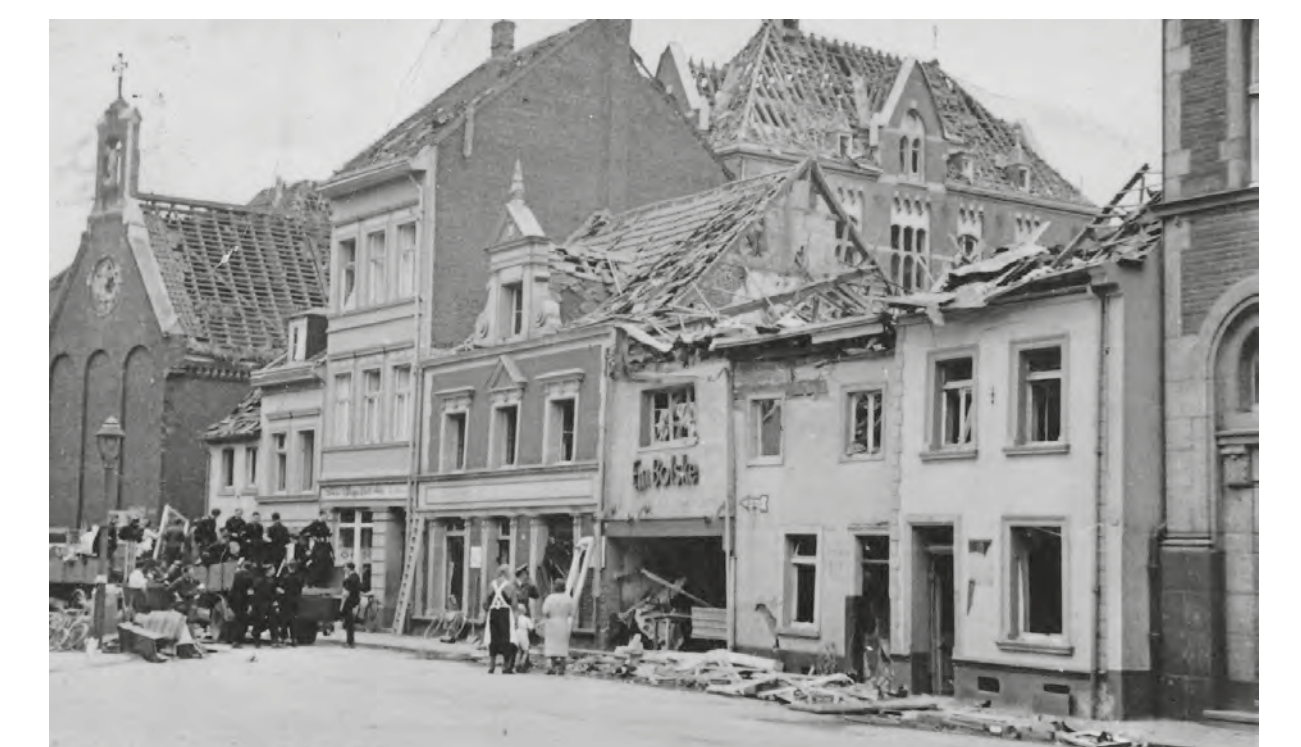
Die Kapelle des Herz-Jesu-Klosters in der Michaelstraße nach einem Luftangriff, 1942