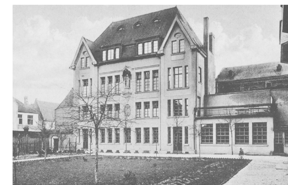
La « Maison Blanche » dans le jardin du cloître, vers 1910

(Sources et texte : archives de la ville de Neuss)