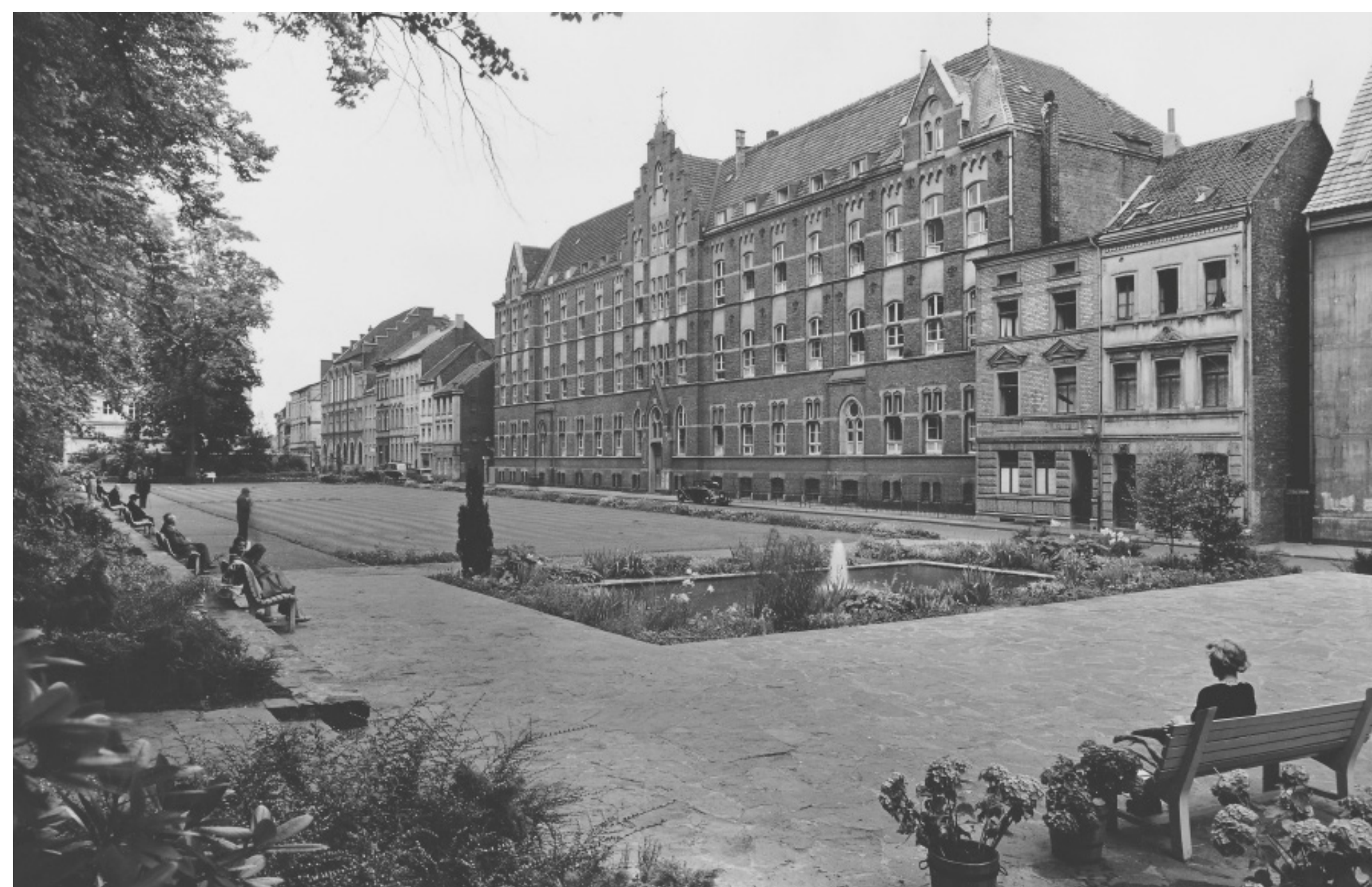
Vue du bâtiment principal depuis la promenade, années 1950

Le nouveau complexe du cloître comprenait également la « Maison Blanche », une dépendance classique construite vers 1909 dans le jardin du cloître. Elle abritait une école domestique avec internat et les chambres économiques des moniales. Dans les bâtiments du monastère se trouvaient également une maison de retraite pour les femmes âgées et une école de soins infirmiers.