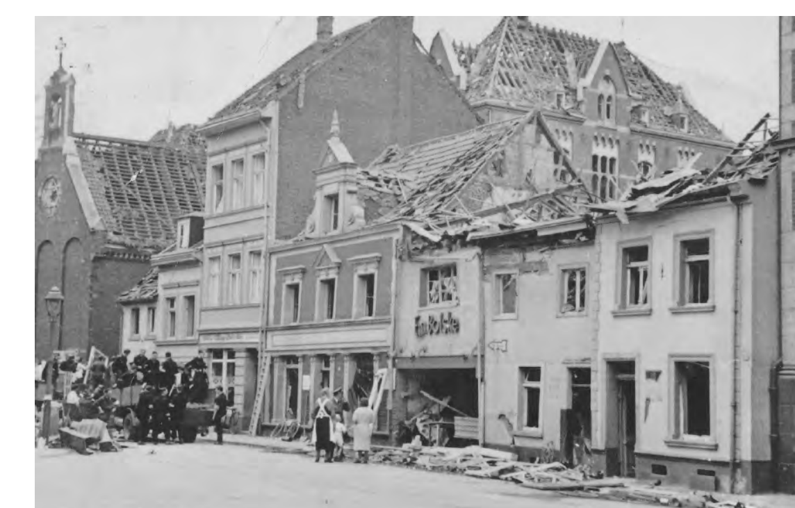
La chapelle du monastère du Sacré Cœur dans la Michaelstraße après un raid aérien, 1942