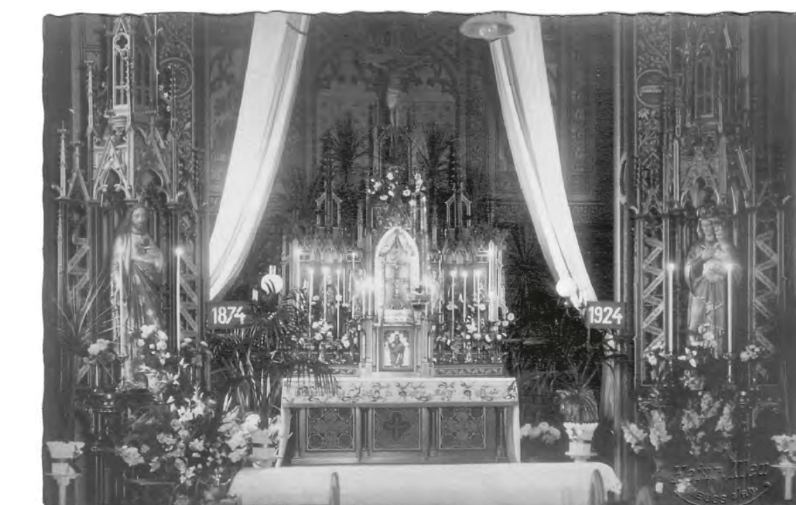
La chapelle du cloître décorée à l'occasion des festivités pour le 500 e anniversaire du rachat de la chapelle et du cloître, 1924