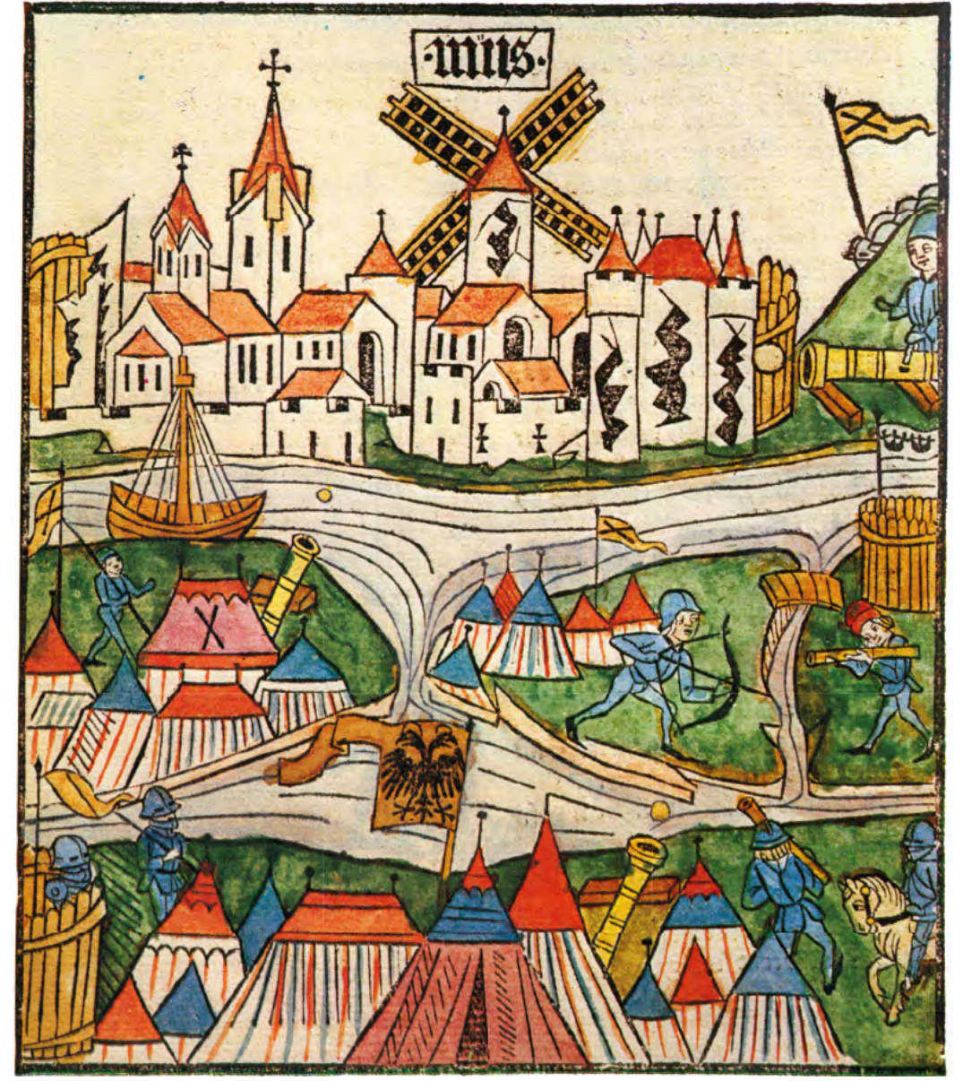
Siège de la ville de Neuss par le duc de Bourgogne Charles le Hardi en 1474-75, en haut à droite l'Obertor endommagée

À partir de 1920, elle fut utilisée comme centre de jeunesse.