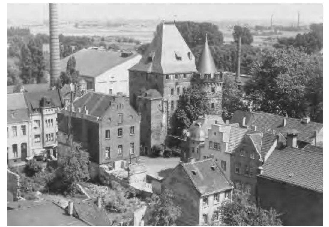
L'Obertor vue du nord-ouest, à gauche l'huilerie Kallen, vers 1955