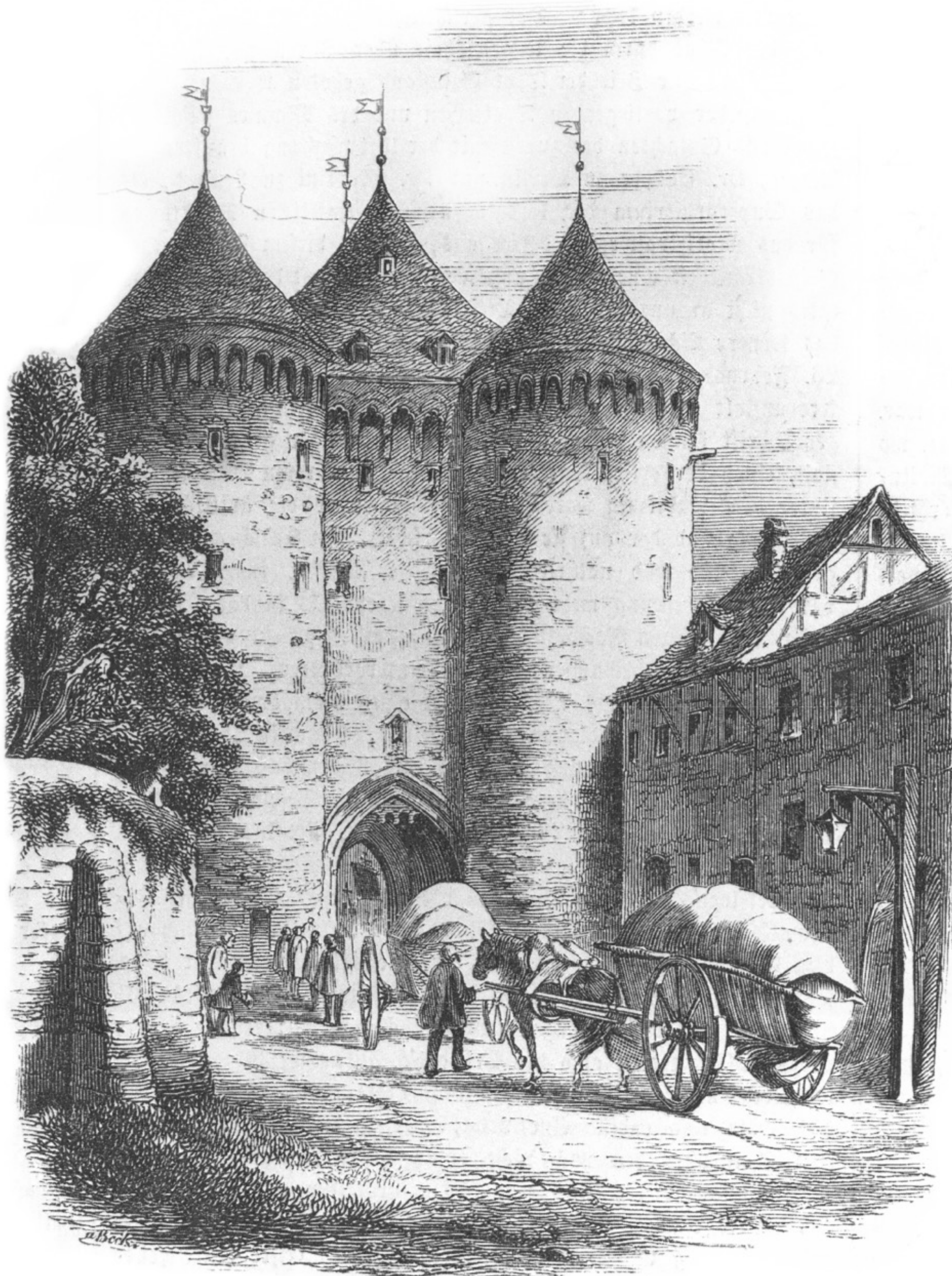
L'Obertor, dessin vers 1853

Lors d'un incendie dans l'un des moulins voisins, l'Obertor fut gravement endommagée en 1900. Lors de la restauration (1900-1906), à laquelle l'empereur allemand Guillaume II a également contribué financièrement, les extensions du côté ouest furent retirées afin que le trafic croissant puisse traverser la porte.