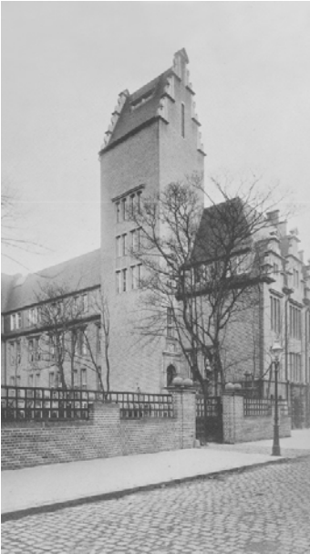
Hier sieht man den Innenhof vom alten Rathaus in der Michaelstraße. Man sieht den Anbau vom alten Rathaus. Das Bild ist ein Foto aus dem Jahr 1920.