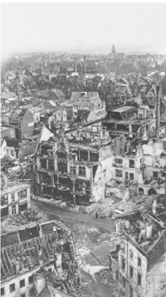
Hier sieht man das Rathaus und andere Häuser nach dem Bomben-Angriff im Jahr 1944. Die Bomben haben das Rathaus zerstört. Rechts sieht man die Sparkasse. Links sieht man das Kaufhaus Rud. Van Endert. Das Bild ist ein Foto aus dem Jahr 1945.