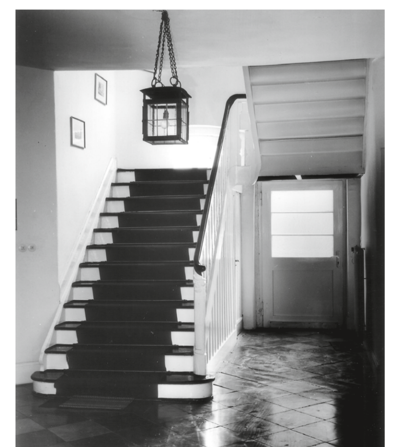
Vieil escalier dans les archives de la ville, photo, 1969

(Sources et texte : archives de la ville de Neuss)