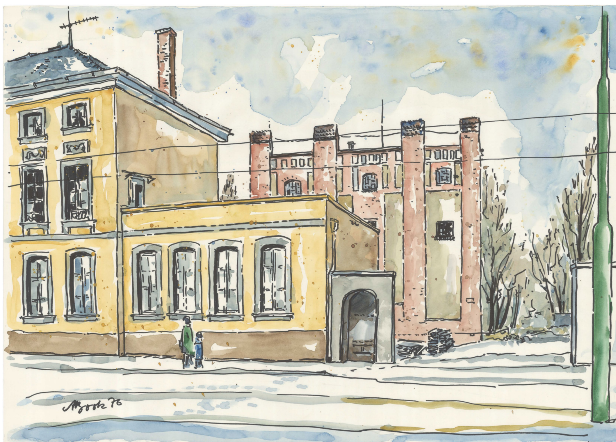
Archives de la ville de Neuss dans l'ancienne poste (1778) et entrepôt de bougies (1909), aquarelle d'Alfred Book, 1976