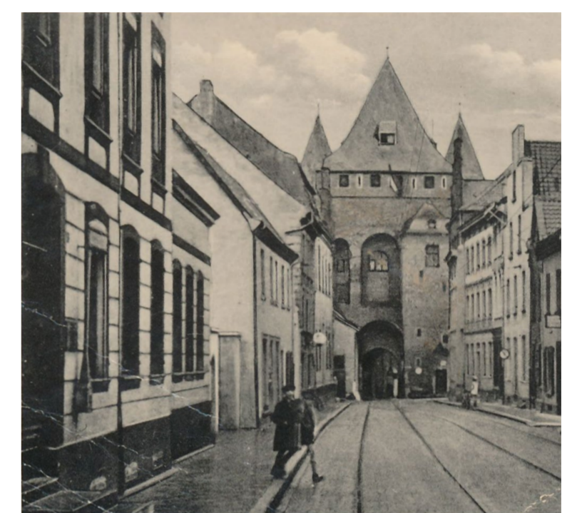
Bâtiment situé au 15 Oberstraße (gauche) avec vue sur l'Obertor, carte postale, vers 1930