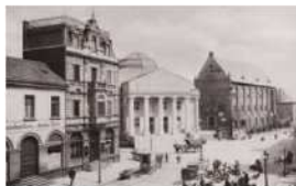
Place du marché avec musée et armurerie, vers 1912