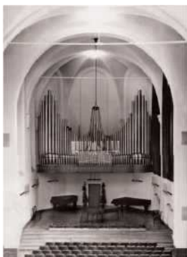
Vue de l'intérieur de l'armurerie alors salle de concert avec l'orgue intégré en 1951