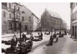
Place du marché avec grand magasin et armurerie, vers 1910