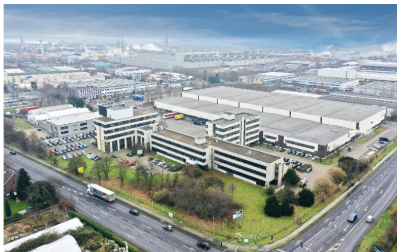
Luftbild des Objektes an der Fuggerstraße 7-11